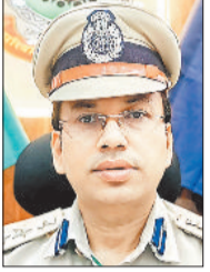
जिला पुलिस ने जारी किया आधिकारिक सोशल मीडिया लिंक

जशपुर पुलिस द्वारा आमजन को अधिक प्रभावशाली एवं पारदर्शी पुलिसिंग से जोड़ने के उद्देश्य से सोशल मीडिया प्लेटफॉर्म पर सक्रिय रहने का आग्रह किया गया है। वर्तमान समय में सोशल मीडिया आमजन के लिए एक महत्वपूर्ण संवाद मंच बन चुका है, जहां प्रतिदिन विचार, सुझाव एवं महत्वपूर्ण जानकारी साझा की जाती हैं। मीडिया समाज का आईना है और सोशल मीडिया के माध्यम से पारस्परिक संवाद की नई संभावनाएं बढ़ी हैं। जशपुर पुलिस के आधिकारिक इंस्टाग्राम, फेसबुक एवं ट्विटर (एक्स) पेजों पर प्रतिदिन ये जानकारीयां दी जा रही हैं