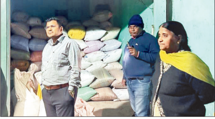
हरिभूमि न्यूज ►► जशपुरनगर